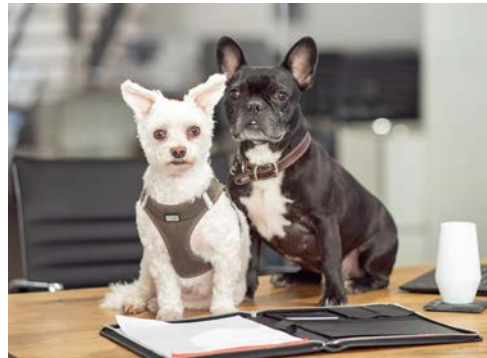
BELLA & RUBI