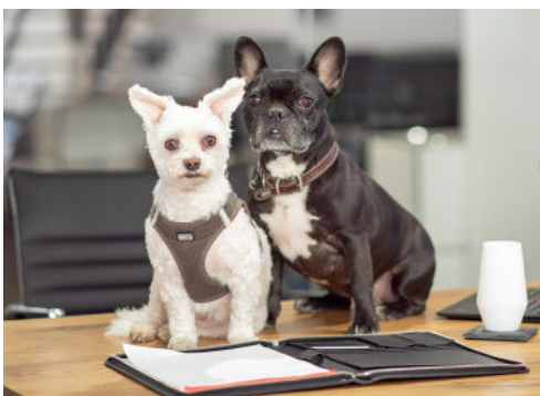
RUBI & BELLA