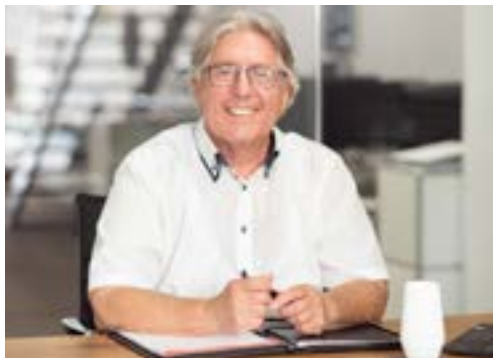
HAJO BÖHM BAUBERATUNG & BAUBETREUUNG